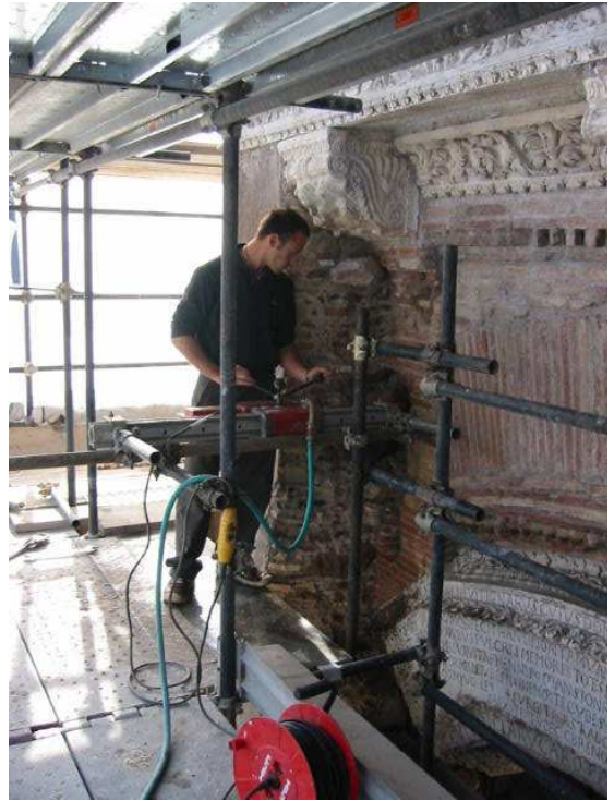
Esecuzione di carotaggi su murature