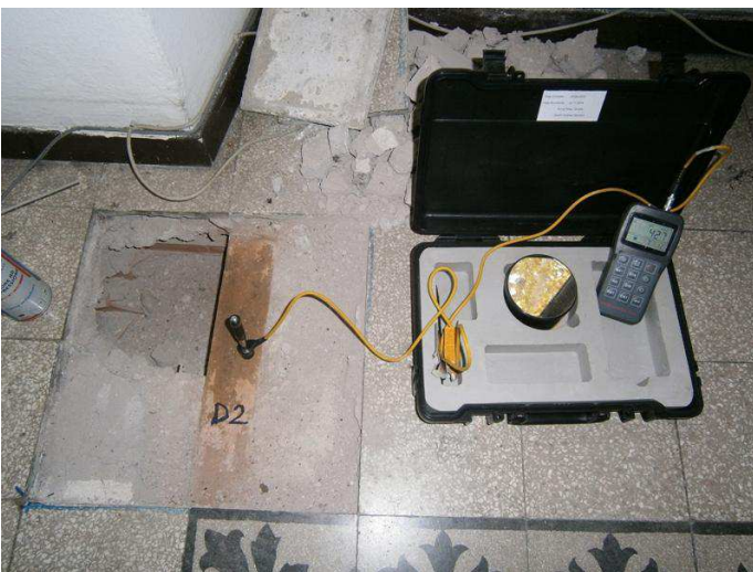
Prove soniche su elementi strutturali

ESECUZIONE DI CAROTAGGI SU MURATURE, ESECUZIONE DI CONTROLLI NON DISTRUTTIVI SU STRUTTURE IN MURATURA E CALCESTRUZZO E MONITORAGGI STRUTTURALI DI OPERE D'ARTE